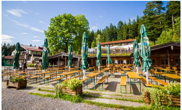
Außenbereich vor dem Stadl

Raummieten (Anmietung ab 19:00 Uhr möglich)